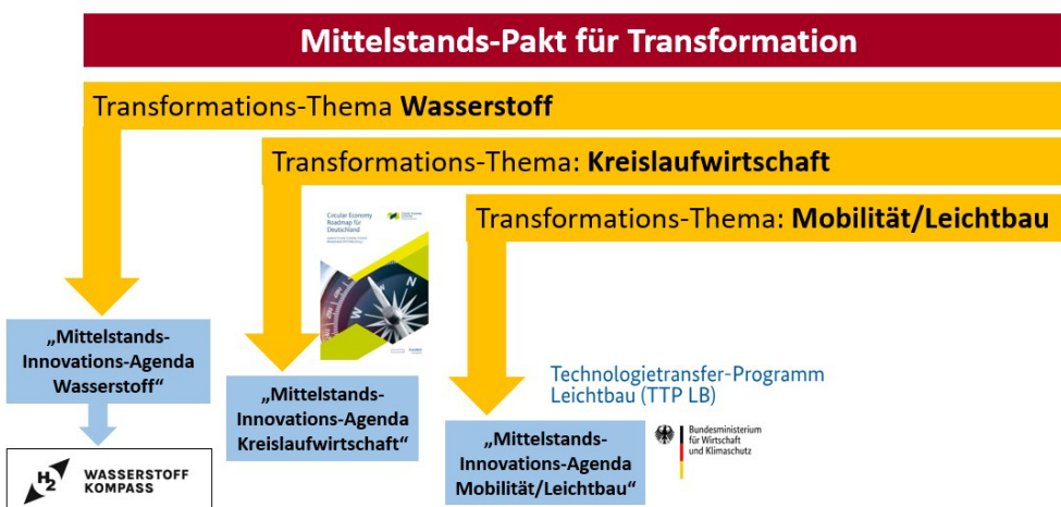
Abb. 2: Mittelstands-Pakt / weitere Themen: Kreislaufwirtschaft – Mobilität/Leichtbau